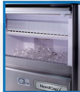
Einfache Reinigung des Pumpenfilters