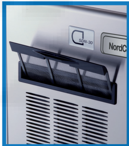
Luftfilter zum Schutz des Kondensators

Bei der Linie SDN sind Verdampferabdeckung, Pumpenschlauch und Sprühdosen durch die AGION-Technologie geschützt.